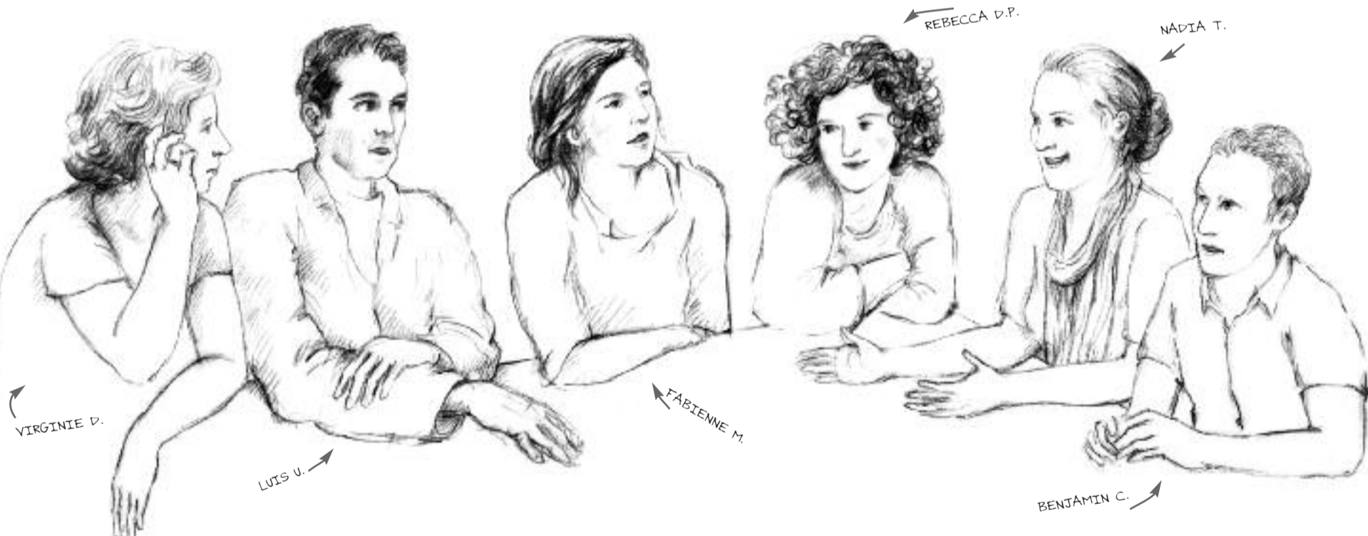
dessin : Stéphanie Nava

Propos recueillis par Rebecca De Pas, et traduits de l'anglais par Céline Guénot